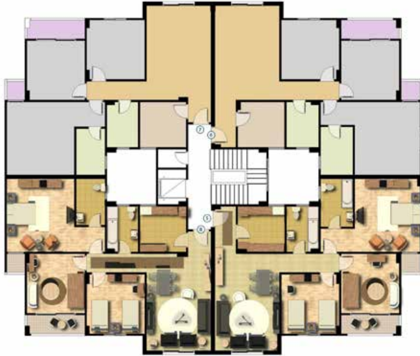
مسقط افقي للدور المتكرر