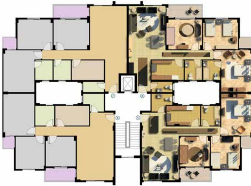
مسطح افقي للدور المتكرر