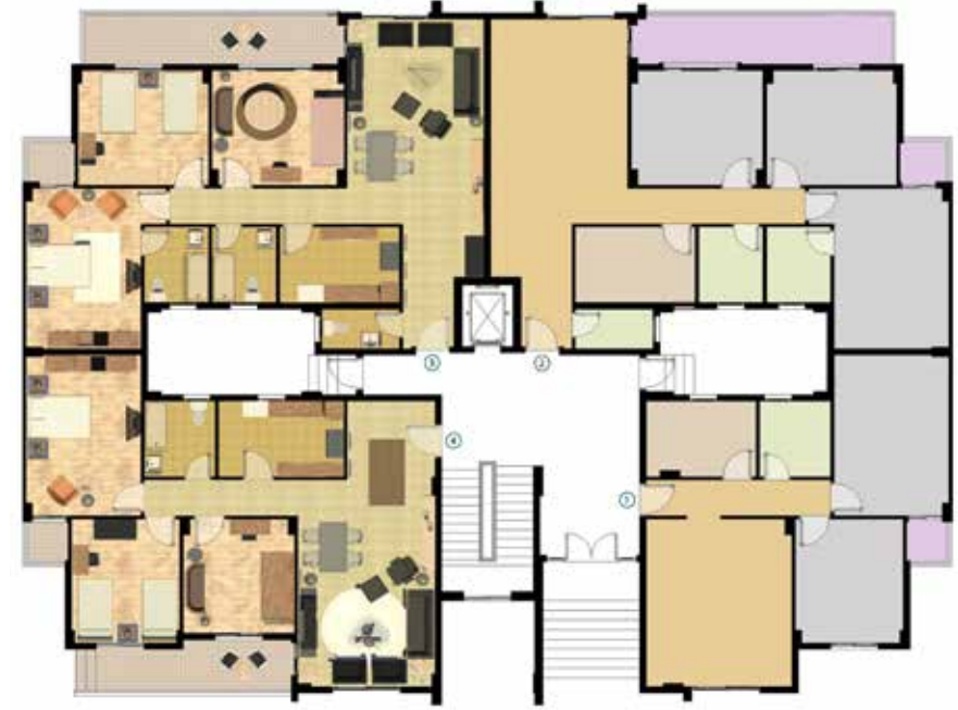
مسطح افقي للدور الارضي