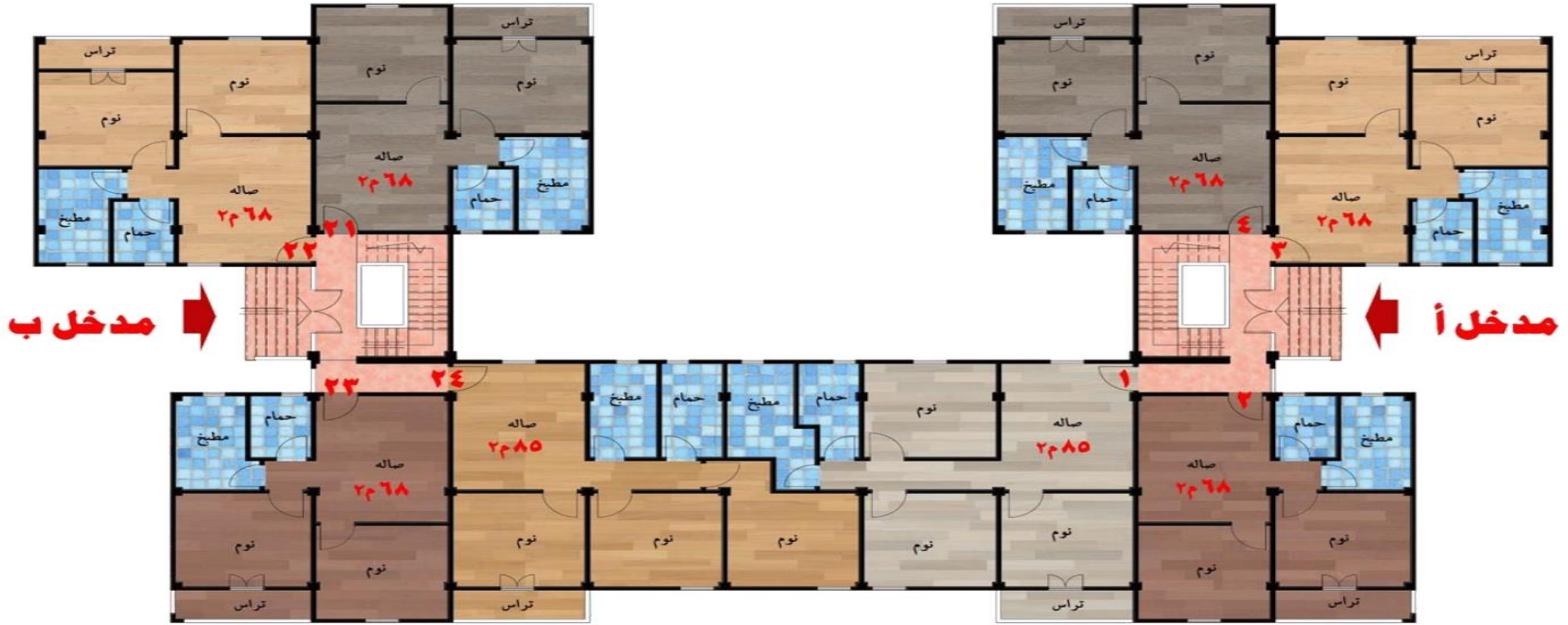
مسقط افقي للدور الارضي